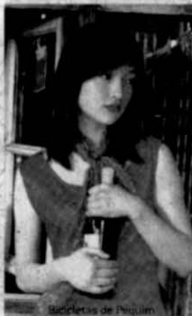
Bicicletas de Pequim